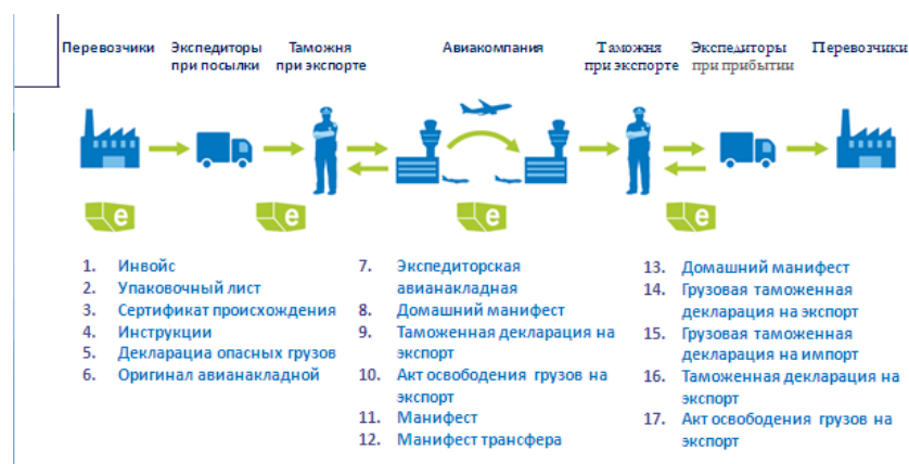
Рис. 3. Введение электронного терминала: на примере Амстердама