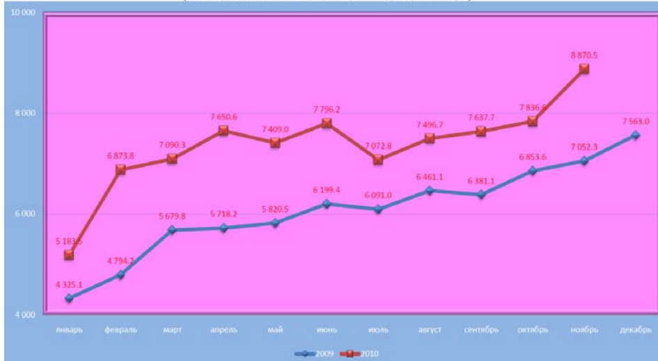
Рис. 4 Динамика взаимной торговли

Динамика общего объема взаимного торгового оборота между странами – членами Таможенного союза за 2009-2010 годы (по методологии Статкомитета СНГ, в млн. долл., по месяцам)